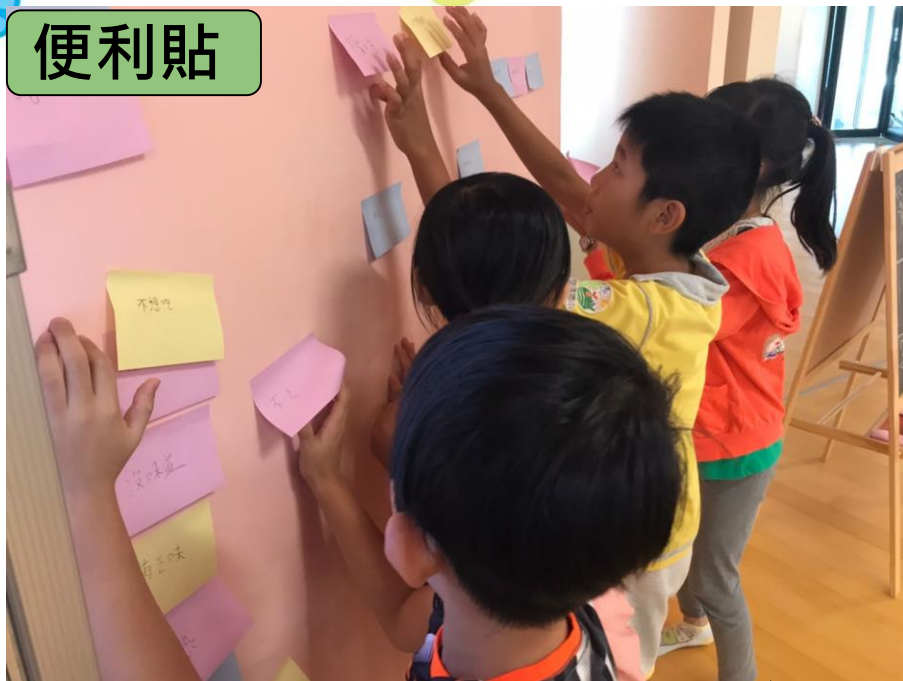
分析廚餘問題的原因